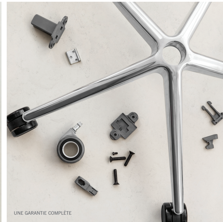
UNE GARANTIE COMPLÈTE