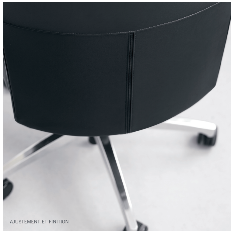
AJUSTEMENT ET FINITION