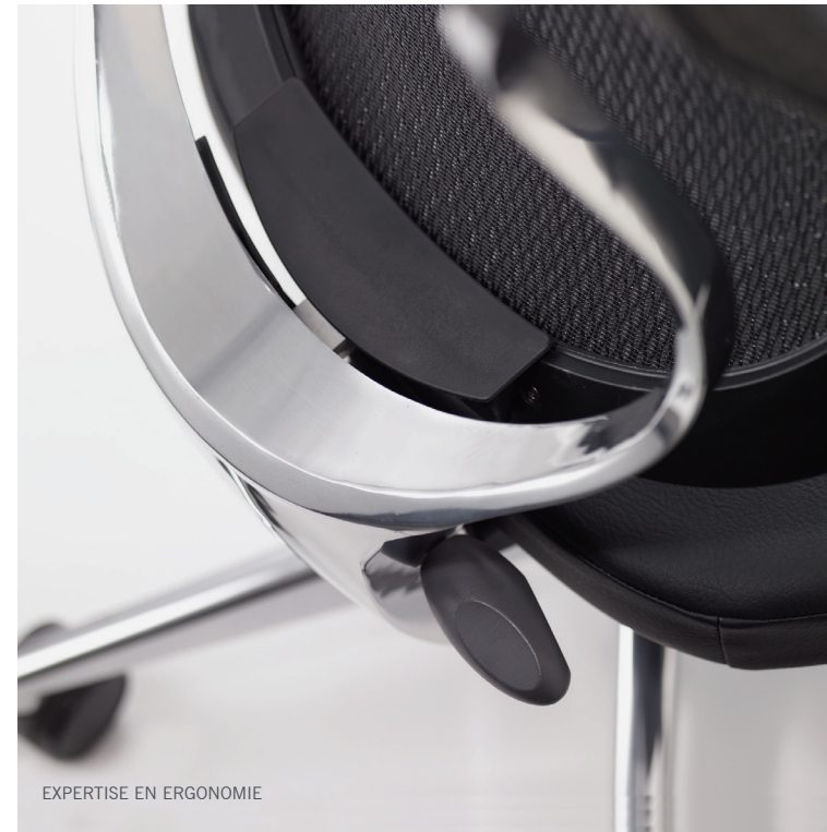
EXPERTISE EN ERGONOMIE