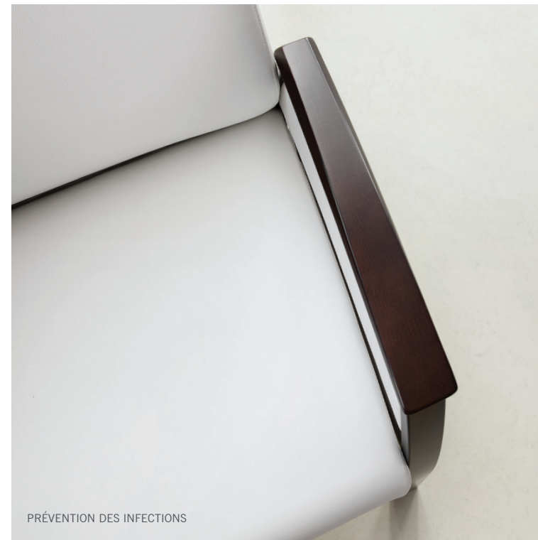
PRÉVENTION DES INFECTIONS